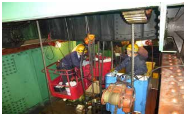
天井クレーンの整備・修理