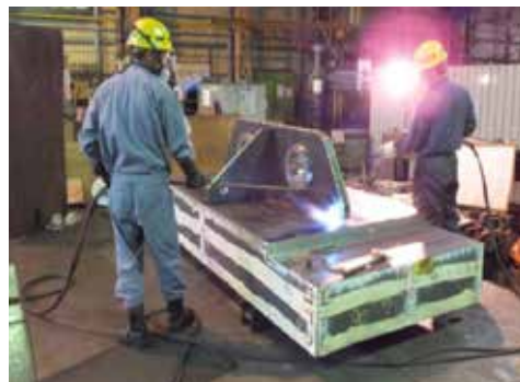
大型機械部品の製作