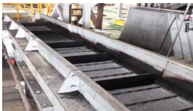
ベルトコンベヤーの据付・修理