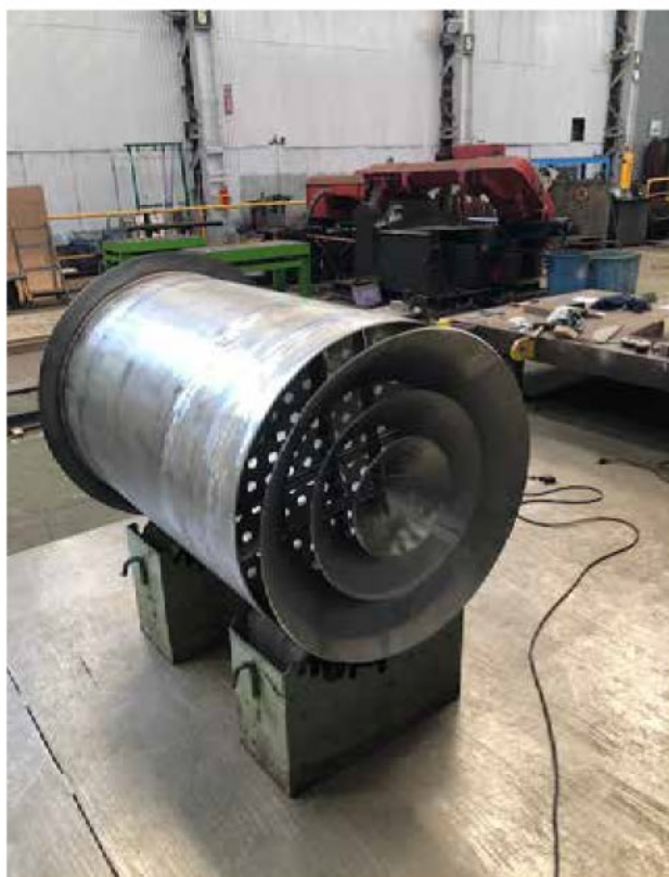
左 ステンレス製 製油所向け小型タンク (径700mm 長さ約1000mm)