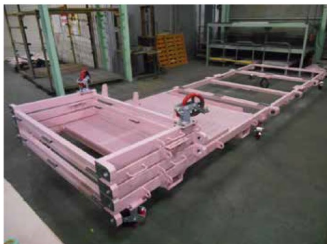
右上 航空事業向け折り畳み式 輸送台車 (幅1500mm 長さ8000mm)