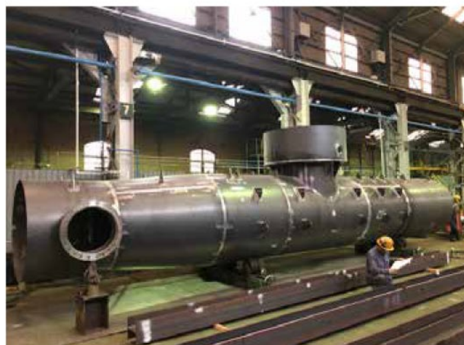
右中 JSW向け熱処理用大型タンク (径1500mm 長さ12000mm)